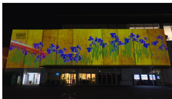
受託した市の花のモチーフ