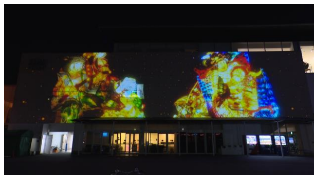
地元のお祭りのモチーフ