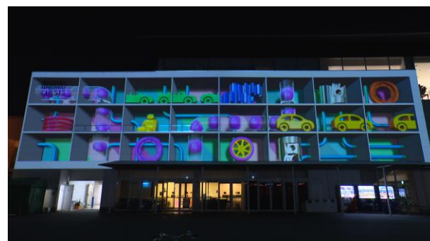
地元に根付いた産業のモチーフ②